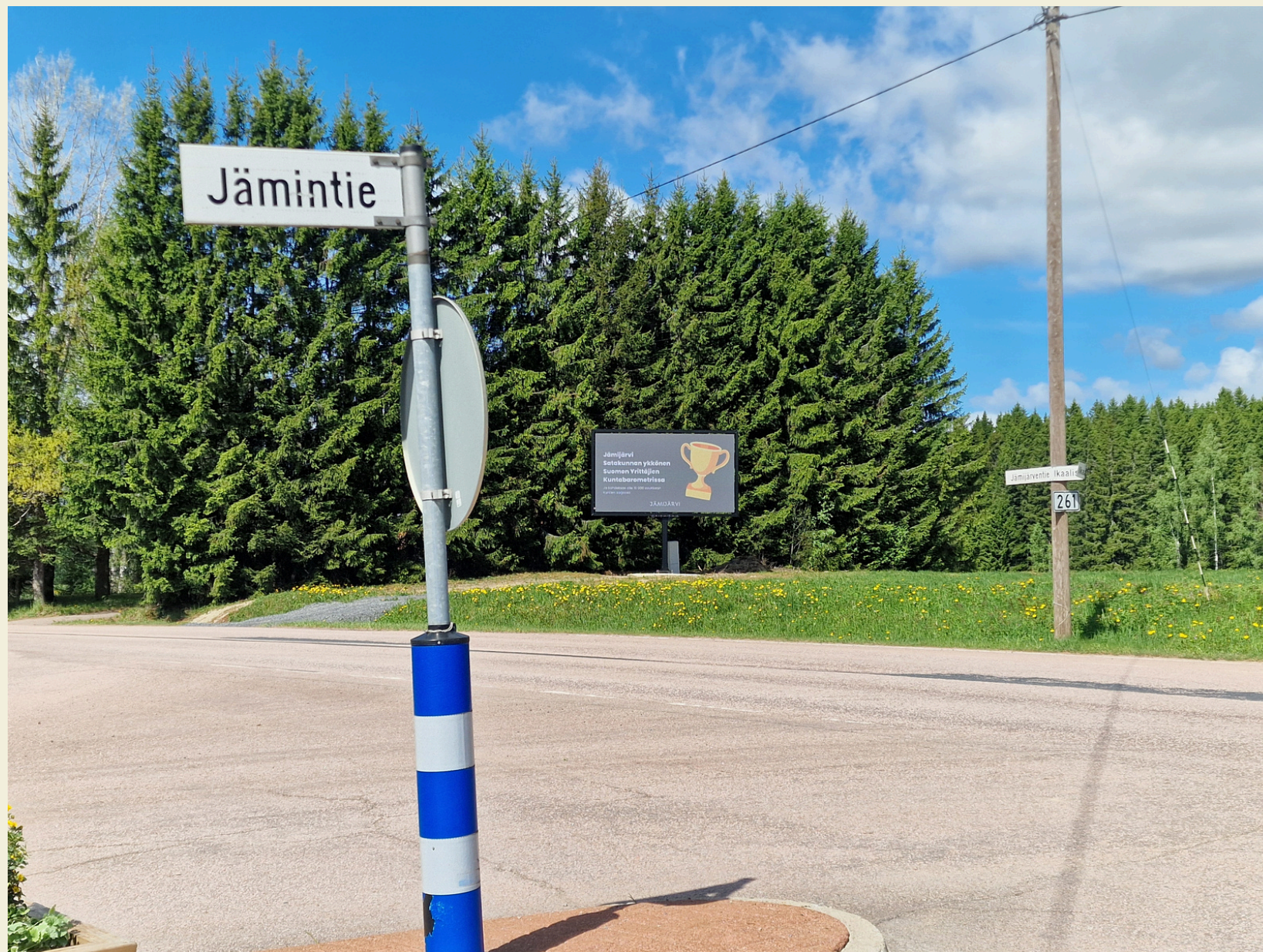
Näyttö 1 Jämintien risteys